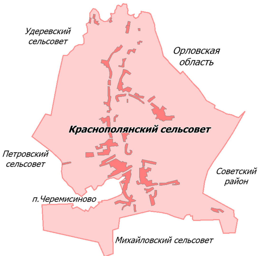
Границы муниципального образования.