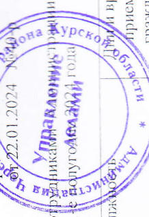
График приема граждан ответственными сотрудниками Черемисиновского района на 1-е полугодие 2024 года

распоряжением Администрации Черемисиновского района